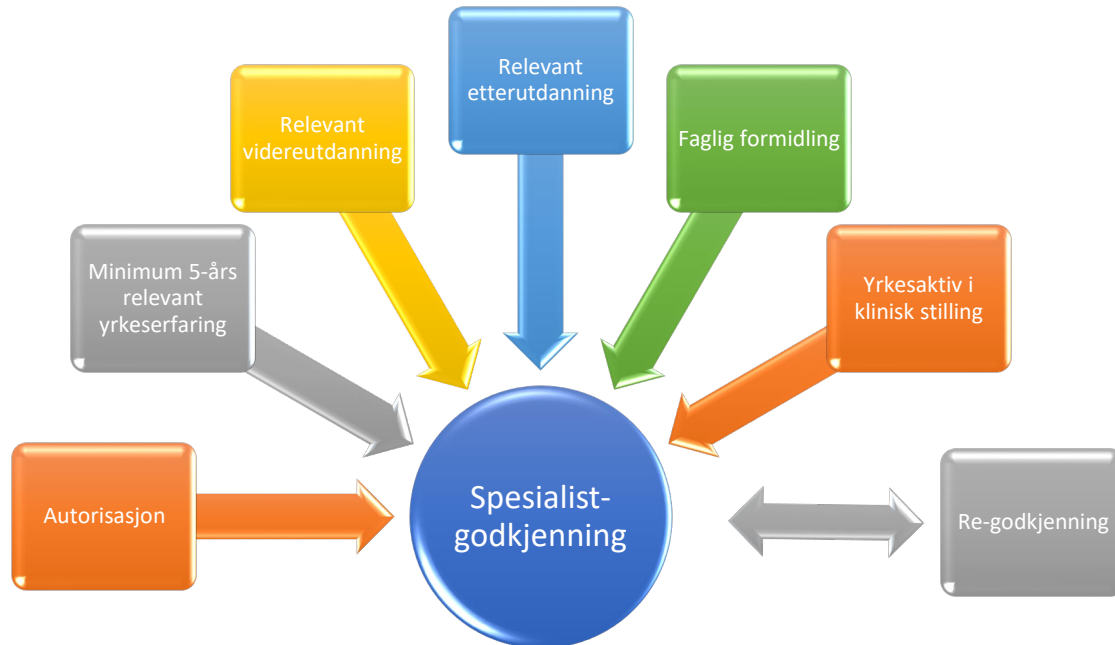
Figur 2 illustrerer krav til spesialistgodkjenning.

Hovedbestanddelene i krav til forbundets spesialistgodkjenning er skissert i figur 2. I søknad om godkjenning stilles det også krav om egenvurdering og refleksjon til egen yrkesutøvelse. Her vil egne refleksjoner som gjelder faglig formidling (internt/eksternt) og tilegnelse av kunnskap, være viktig å utdype. Videre vil begrunnelse for søknad, fremtidig målsetting og refleksjoner rundt videre arbeid være nyttig ved vurdering av søknaden, da vurdering skjer etter en helhetsvurdering. Det stilles også krav til attestering fra leder og faglig leder. Søknadsskjemaene må være komplett utfylt, det vil si at man må besvare alle punkter for å bli vurdert. Godkjenningen er for fem år, og det må søkes om re-godkjenning i henhold til gjeldende krav før femårsperioden utløper.